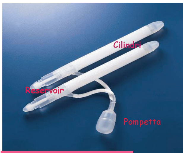
Fig 1 Protesi idraulica bicomponente

Ovviamente questo tipo di chirurgia deve essere effettuata in Centri di eccellenza ed il paziente vi deve giungere anche con un adeguato counselling psico-sessuologico nel cui contesto viene accuratamente spiegato il tipo di intervento e la successiva gestione della protesi peniena impiantata.